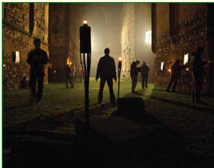
Během celé noci navštívilo klášter Rosa coeli přes tisíc hráčů. Hráči si prostory kláštera prohlíželi v úplné tichosti, aby dodrželi pietu místa.

Príspevek byl zkrácen redakcí Dolnokounického zpravodaje. Celý jeho obsah včetně šifer a fotografií najdete na www.dolnikounice.cz rubrika Co se nevešlo do DK zpravodaje.